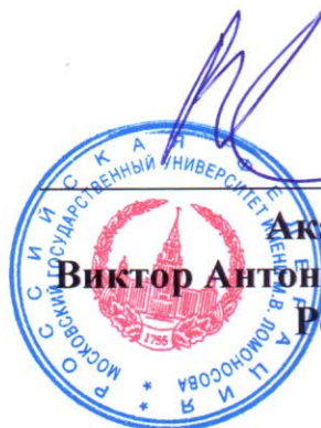
Академик Виктор Антонович Садовничий, Ректор